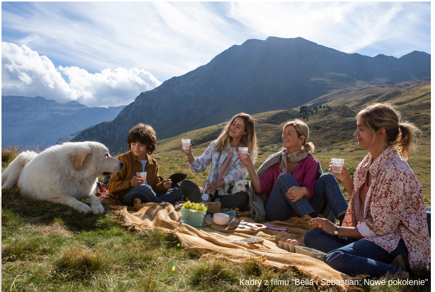
Kadry z filmu "Bellá i Sebastian: Nowe pokolenie"